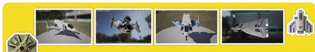
エースコンバットチームが、過去に作成した「ソルバルウの3Dモデル」